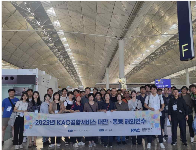
홍콩 공항 견학