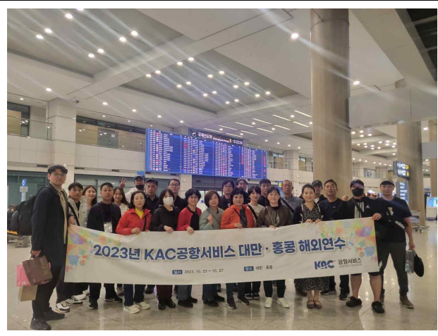
한국 귀국 단체사진