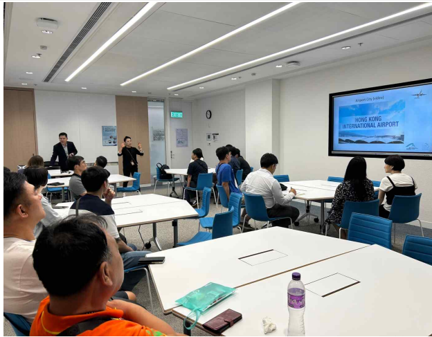
홍콩 공항 담당자 브리핑