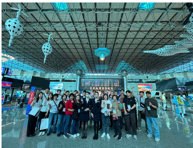
대만 공항 인솔 단체사진