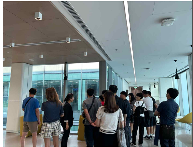
홍콩 공항 담당자 인솔