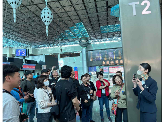
안내카운터 인솔 중 브리핑