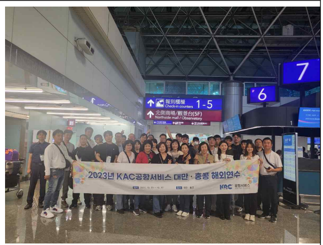
대만 공항 견학