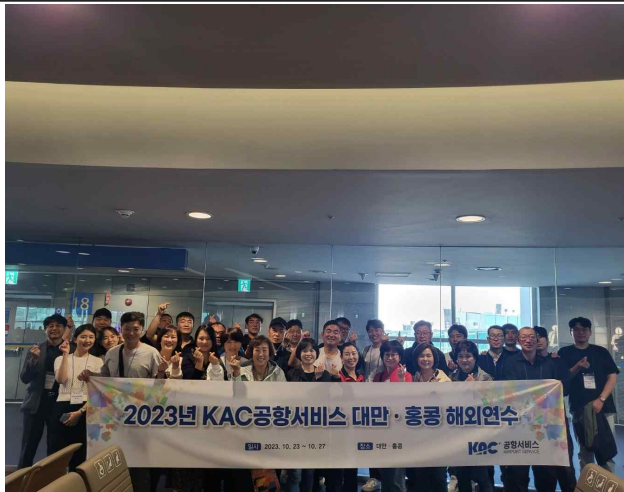
연수 출발 전 단체사진