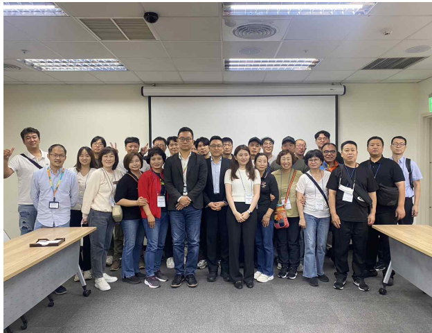
대만 공항 회의실 단체사진