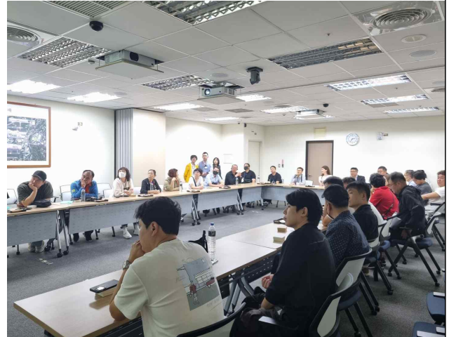
대만 공항 담당자 브리핑