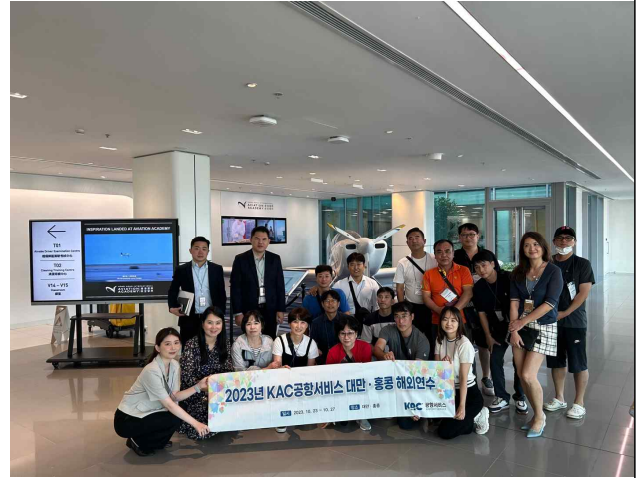
홍콩 공항 회의실 단체사진